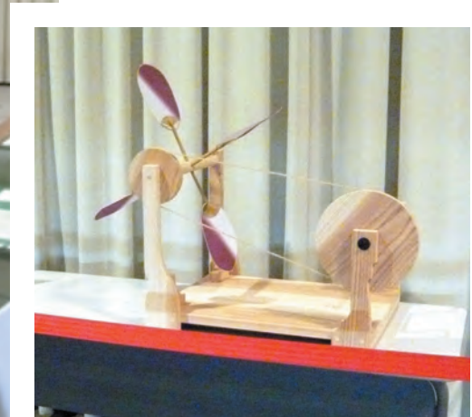
特別展のポスターになった特許第12号 納涼團扇車 (図面をもとに作成)