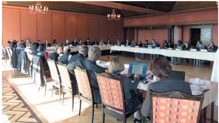
ICA 執行委員会 (2010年9月12日)