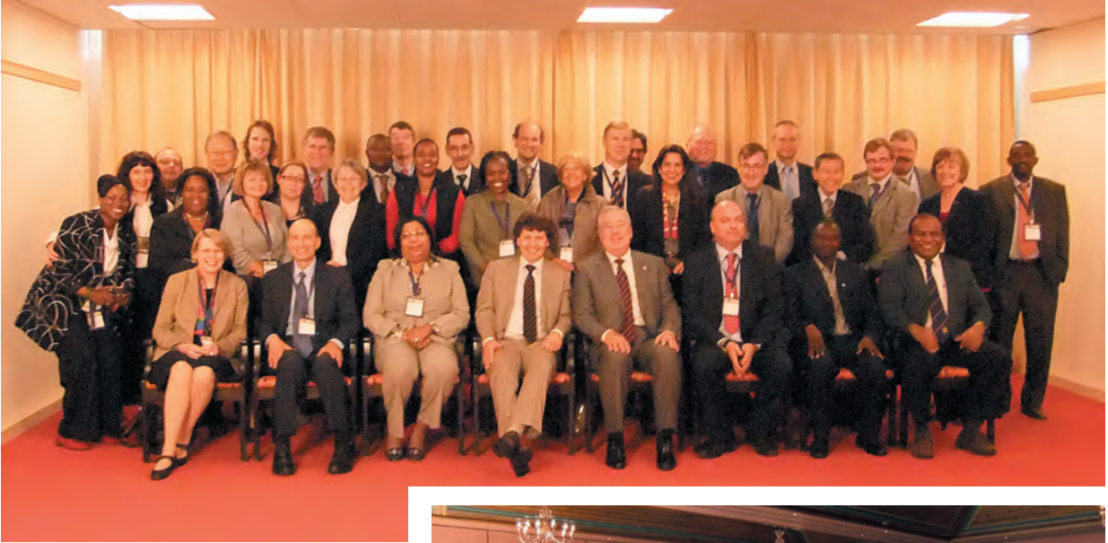
ICA 執行委員会メンバー (2010年9月12日)