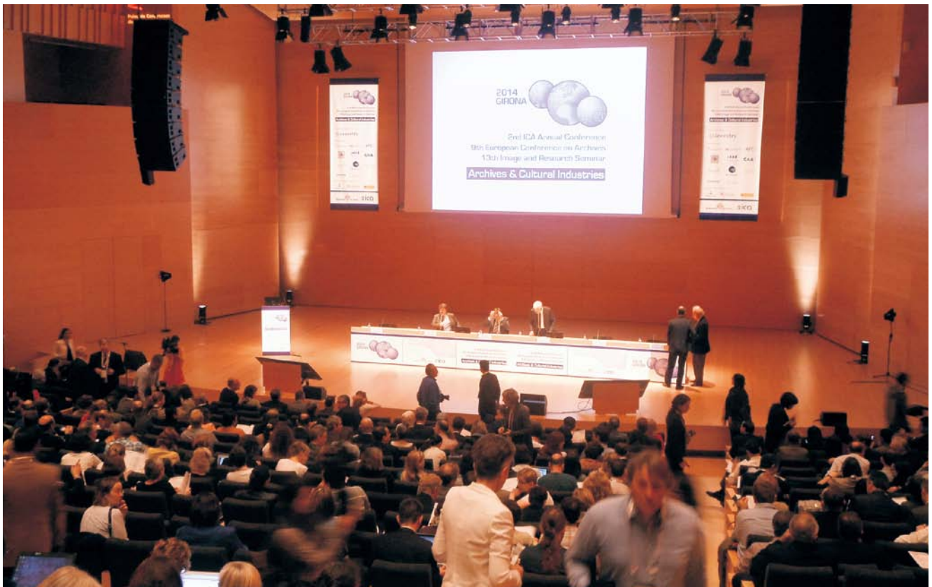
第2回 国際公文書館会議 (ICA) 年次会合 (スペイン・ジローナ) (2014年10月11日～15日)