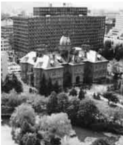
写真 北海道文書館

今年4月、開館以来独立した出先機関であった文書館は、法制文書課の内部組織となって21年目の再スタートをきりました。19人の職員は12人に削減されましたが、条例設置の公の施設としては維持されました。小さな組織にはなりましたが、これまで寄せられた史料保存への危惧や文書館への期待に応えるためにも、職員が知恵を出しあって、できる限りのサービスを提供し、各方面との連携を一層強めていかなければならないと考えているところです。