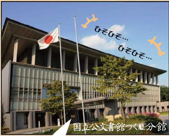
国立公文書館つくば分館