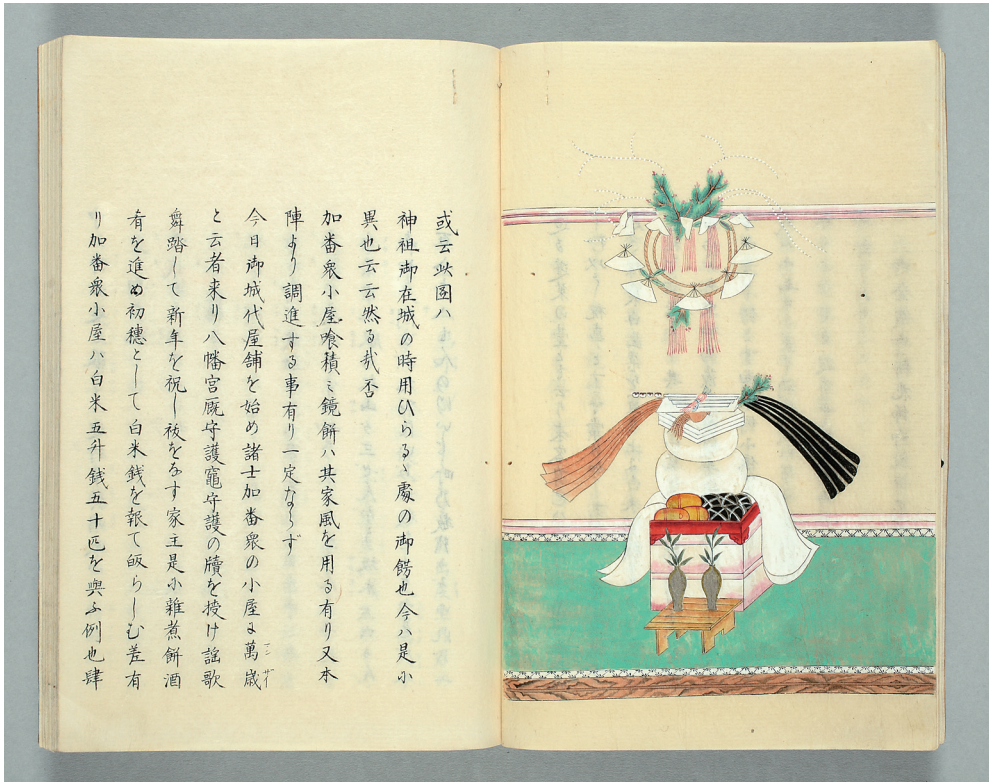
徳川家康在城のおりに用いられた駿府城の鏡餅（『駿国雑誌』）