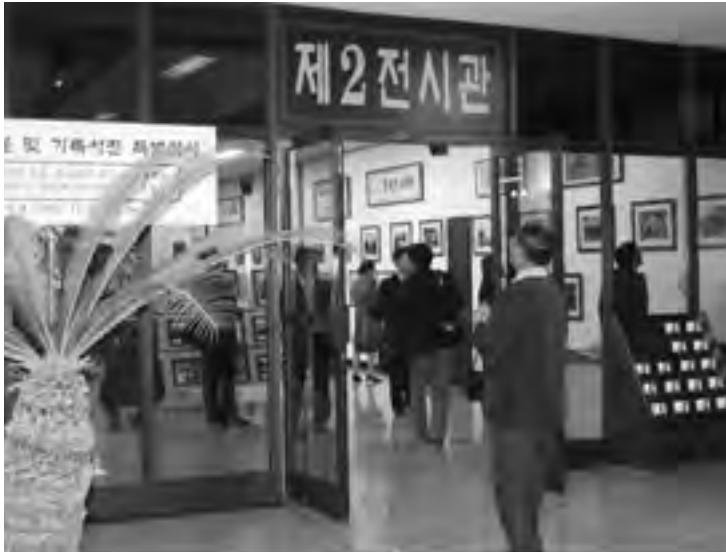
釜山支院第2 展示館

て、広く国民に周知し理解を得て、歴史公文書等の保存及び利用に関する日本の中核としての国立公文書館の充実強化が図られる様、鋭意取り組んでいるところである。