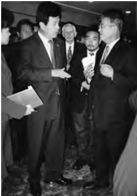
韓国行政自治部副大臣との懇談