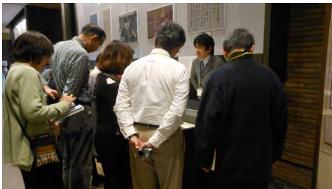
常設展示説明観覧