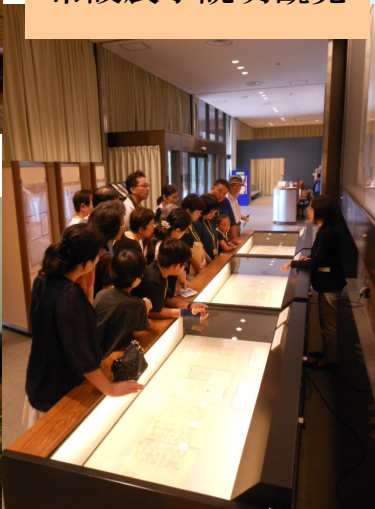
常設展示説明観覧