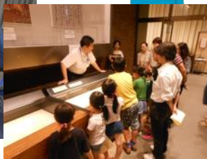
これまでのアーカイブズツアーの様子