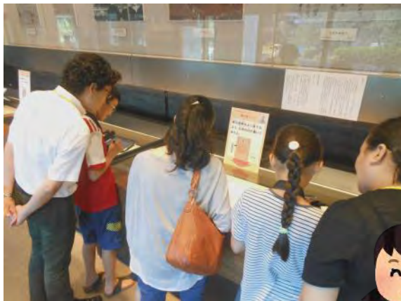
「私の夢法案」作成ゲーム

ふだん こくりつこうぶんしょかん しょこ たんけん この夏、普段は入ることのできない国立公文書館の地下の書庫を探検してみませんか？ てんじしりょう 展示資料やゲームから歴史を学んで、こどもアーキビストになろう！