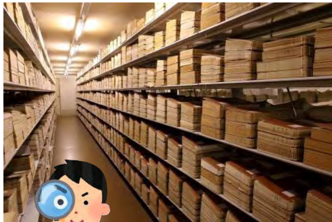
地下の書庫を探検！