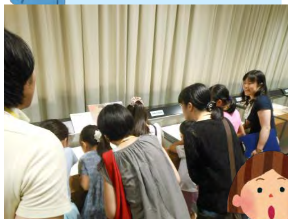
展示資料を見てみよう！