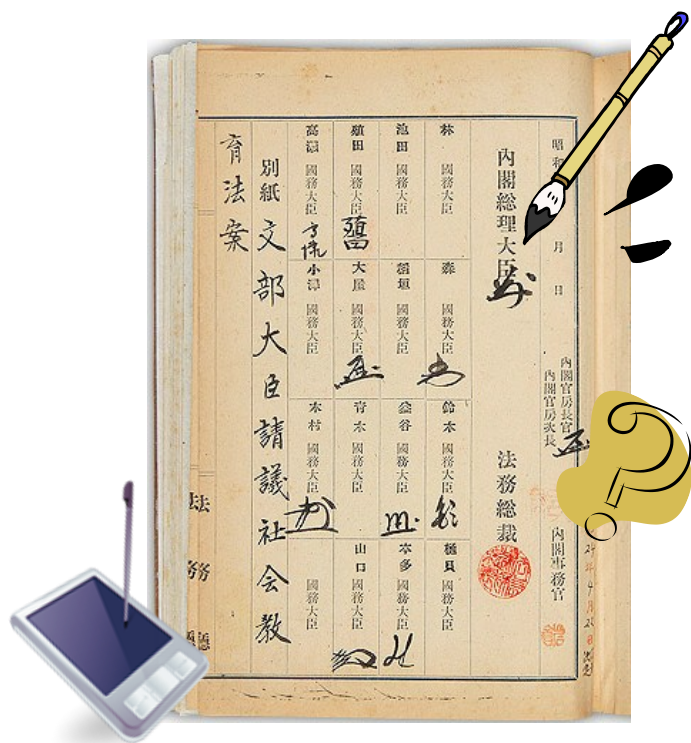
「私の夢法案」作成ゲーム

独立行政法人国立公文書館では、気軽に公文書館や公文書を親しんでいただく「中高生のための国立公文書館体験ツアー」を実施します。