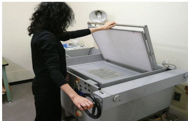
「リーフキャストによる修復」