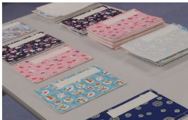
「四つ目綴じの作品」