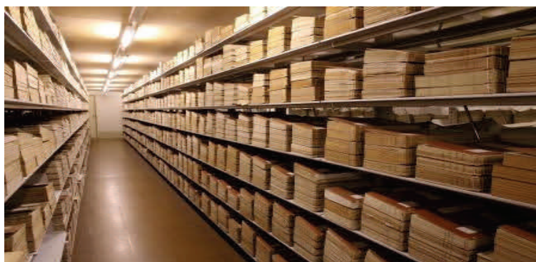
「国立公文書館書庫の様子」

【対象】 一般(18歳以上。なお、児童または生徒を同伴する親子等の参加は可能。)